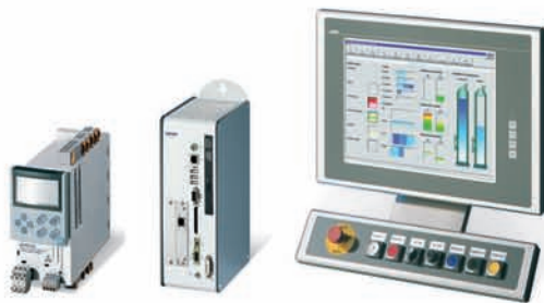
Steuerungen und Industrie-PCs