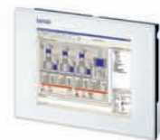
Software, I/O und Visualisierung