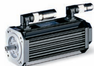
Standard-Drehstrommotoren, Synchron- und Asynchron-Servomotoren